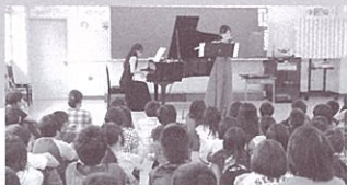
霧丘小学校(西村・早川)

響ホールを中心に市内の音楽文化の浸透を図るために地元や在京の演奏家が小学校や市民センターなどに直接出向き訪問コンサートを行うもので、クラシック音楽を身近に親しんでいただくことを目的に行っています。