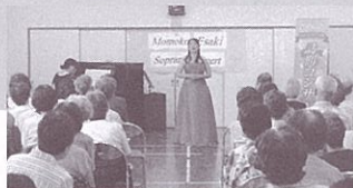
南小倉市民センター(江崎・広瀬)

詳しい情報はWEBでご覧下さい。 http://www.kicpac.org/music/outreach/index.html